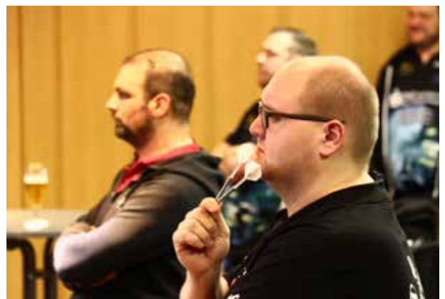
Während sich die einen an den freien Scheiben warmwerfen (links), verfolgen die anderen gebannt die Legs der Kollegen.