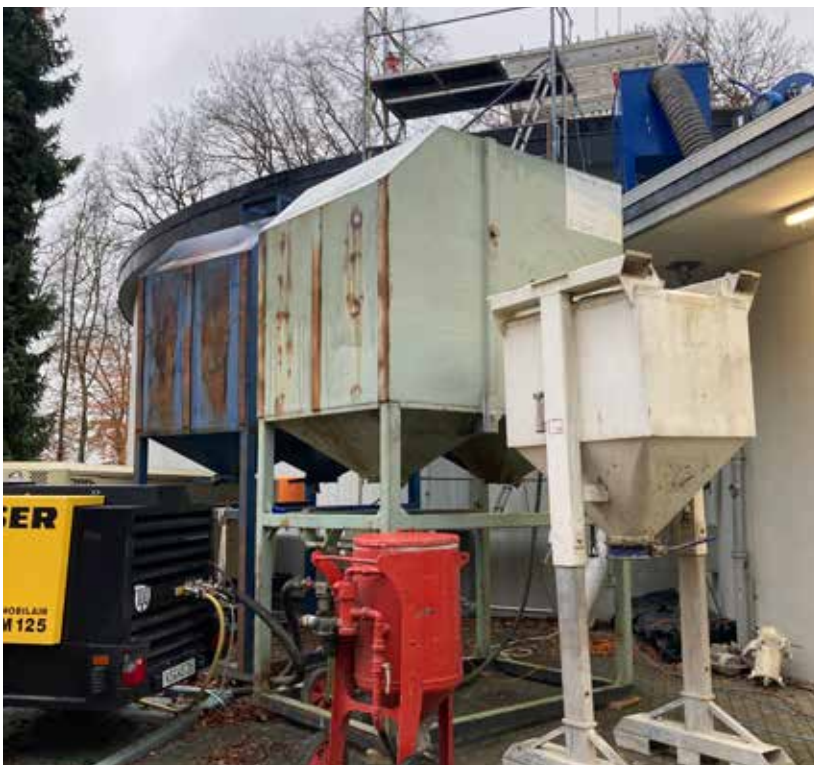
Eine Spezialfirma rückte für die Strahlarbeiten mit schwerem Gerät an.

Die Kammer ist nun mit einer speziellen Mörtelbeschichtung nach neuesten Sicherheits- und Hygienestandards ausgekleidet, in die kein Wasser eindringen kann. Vor der Sanierung war sie mit Fliesen ausgekleidet. „Mit den Jahren können sich hinter diesen jedoch Toträume bilden und die Verkeimungsgefahr steigt, deshalb die neue Oberfläche“, sagt Projektleiterin Saskia Hahn.