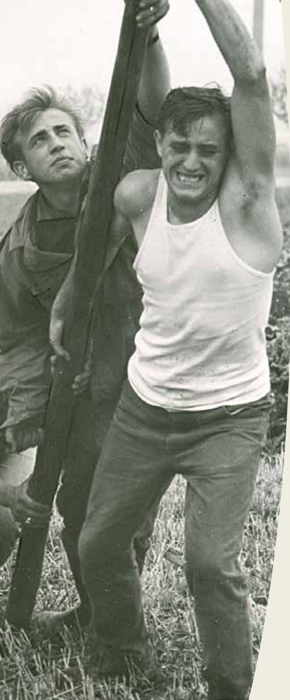
Mit Muskelkraft und Manpower werden Ende der 50er Jahre Strommasten aufgestellt (oben). Bauwerke wie die Windkraftträder auf dem Wartenberg (rechts) waren seinerzeit schier unvorstellbar - und gehören heute zum Landschaftsbild.

„Der Oberhesse ist von Natur meinen Landsleuten, den Bayern, in der Eigenschaft der Dickköpfigkeit vielleicht noch überlegen.“ Dieses Zitat ist überliefert vom ersten Steuermann, vom ersten Kapitän jenes Unternehmens, das heute unter der Dachmarke OVAG firmiert. Jener Richard von Stadler (1875 bis 1955) nahm Ende 1911 die Planungen für die zu errichtende „Elektrische Überlandanlage“ auf, die er im darauffolgenden Jahr in einem bescheidenen Werkshäuschen mit vier Zimmern in der Frankfurter Straße in Friedberg - eine Shell-Zapfsäule stand vor der Tür - umsetzte.