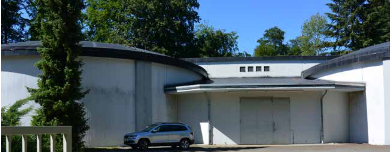
Der Hochbehälter Wannkopf besteht aus zwei Wasserkammern. Die linke, Kammer Inheiden, wurde jetzt saniert. Rechts die Kammer nach den Strahlarbeiten.

Mit umfangreichen Sanierungen hat die OVAG seit Oktober 2019 den Hochbehälter Wannkopf im Berstädter Markwald in der Wetterau fit für die Zukunft gemacht. Für rund eine halbe Million Euro wurde die linke der beiden Wasserkammern instandgesetzt und eine neue Lüftungsanlage eingebaut. Zusätzlich wurde die Elektrotechnik erneuert. „Es